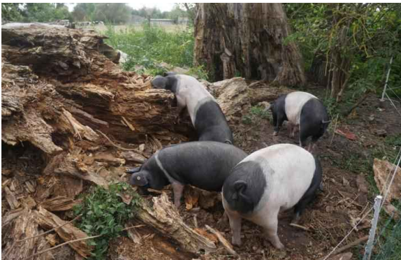
Glückliche Schweine mit einer alten Pappel

Wir wünschen uns, dass unsere Schweine in unserem neuen Zuhause auch weiterhin Schwein sein dürfen und wir sie artgerecht halten können Sie danken es in Form von leckerstem Fleisch,