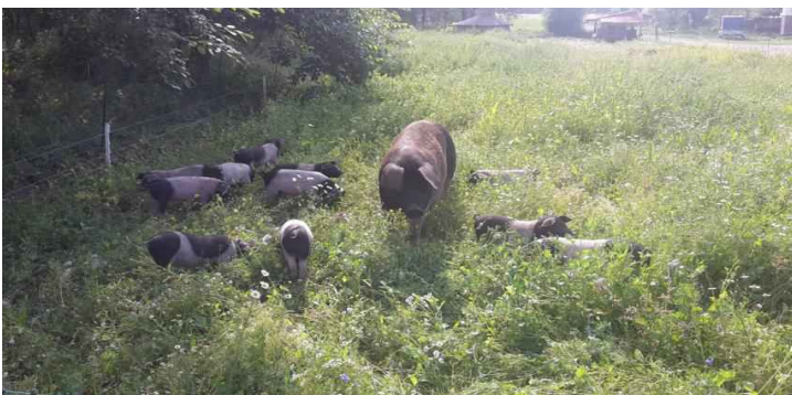
Frisches Grün. Toll!

Auf gut einem Hektar Land werden in Koppelwirtschaft die Schweine, von Geburt bis zum stressfreien Ende in einer kleinen Landschlachtereier, liebevoll über mindestens ein Lebensjahr aufgezogen.