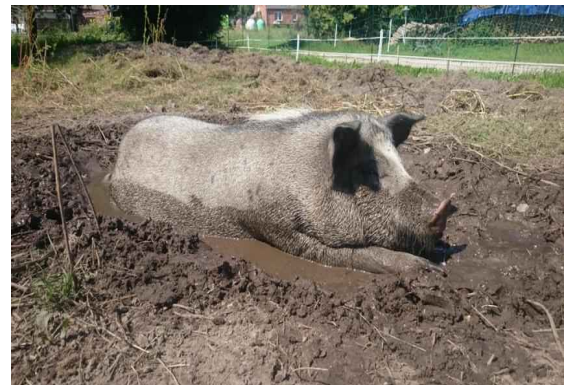
... und der Papa