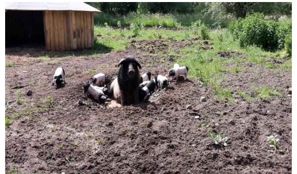
Schlappie mit ihren Kindern...

das unsere Kunden, und wir selbst natürlich auch, sehr zu schätzen wissen