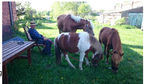
Ollie, Sam und dahinter Tommy.

Für unseren etwas anderen Bauernhof benötigen wir zur Miete und Pacht neben Wohnraum für uns, 2-5ha Land, einen Teil einer Scheune o.ä. für unsere Kühlzelle und für die weitere Verarbeitung von Fleisch und Honig. Gerne aber auch zur Mitbenutzung. Laut Veterinäramt müssen wir den Platz zur Einstallung der Schweine oder des Geflügels vorweisen können und die Freilandhaltung muss mittels Knotenzaun von den Wildtieren abgetrennt sein.