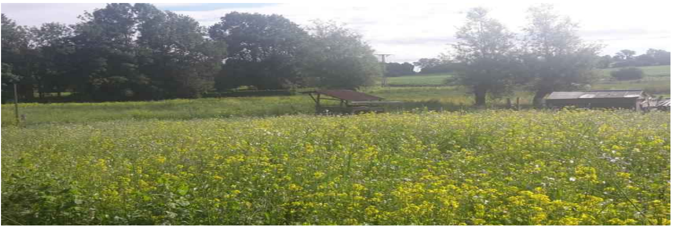
Mobiler Stall und Futterstand in blühenden Koppeln

Die Koppeln werden nach jedem Umweiden mit Hilfe der Pferde und dem Traktor mit einer Blümmischung neu angesät, damit unsere derzeit 9 Bienenvölker nicht nur den Nektar aus dem ganzen Dorf, sondern auch auf dem eigenen Land finden.