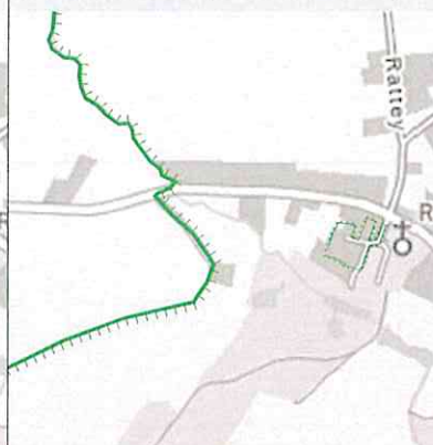
LSG nach Ausgliederung