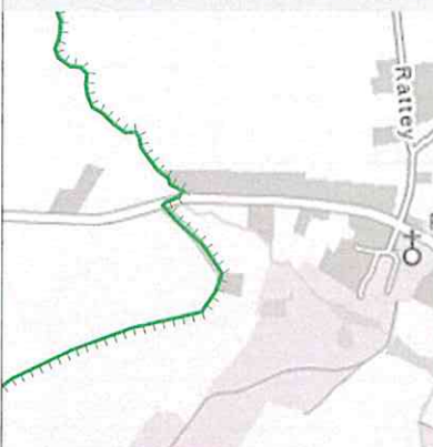
LSG vor Ausgliederung