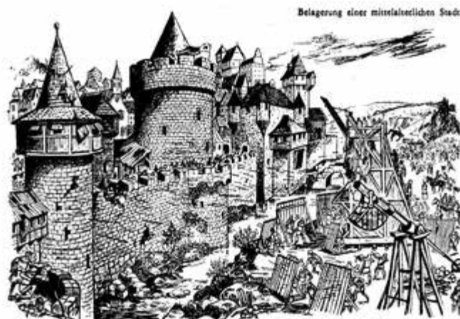
Belagerung einer mittelalterlichen Stadt, Zeichnung: Harri Förster, Lehrbuch Geschichte, Klasse 6, Verlag Volk und Wissen Berlin, 4. Auflage, 1970, S. 99

Die Brandenburger unternahmen einen letzten Versuch, in die Stadt einzudringen. Sie gruben in der Nähe der Mauerreste der alten Burg einen unterirdischen Gang unter der Mauer. Mit Holz wurde der Gang gesichert. Die Woldegker gruben leise einen Gegengang und füllten ihn mit Wasser. Da auch hier einige Söldner wegen der hereinstürzenden Wassermassen ihr Leben lassen mußten, brachen die Brandenburger zu Beginn des Jahres 1316 ihr Lager ab und zogen nach Neubrandenburg [6]. Auch hier versuchten sie vergeblich, diese Stadt zu nehmen. VK Warnke“ (VK - Volkskorrespondent)