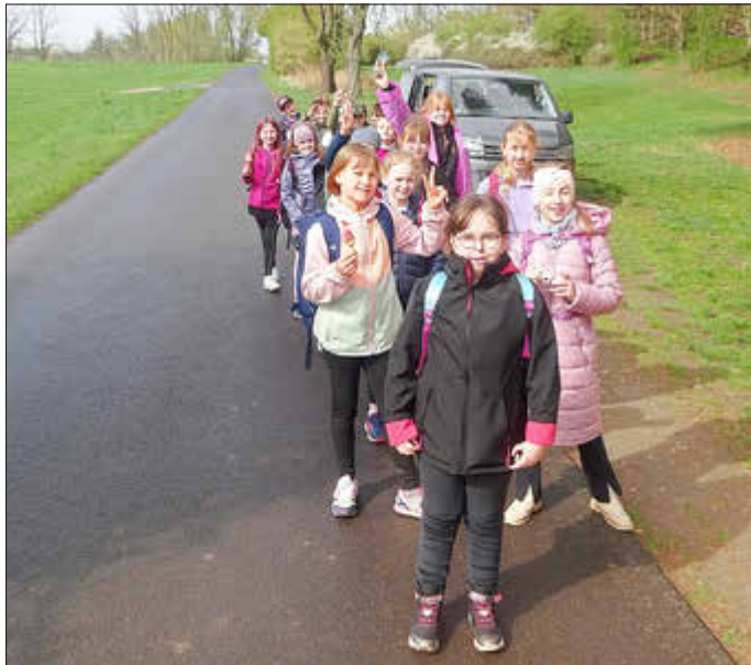
12 Kilometer legten wir zu Fuß zurück!