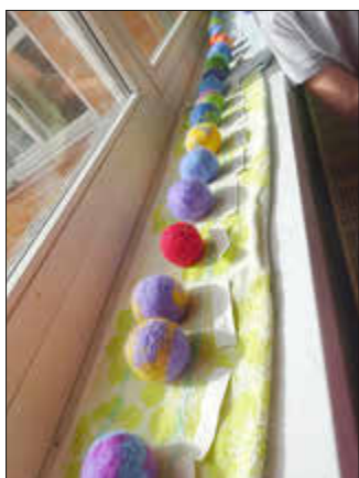
Am Ende freuten wir uns, über unsere vielen schönen Bälle.