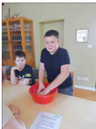
Für unsere selbstgebackenen Bötchen brauchten wir ganz schön Muckis.