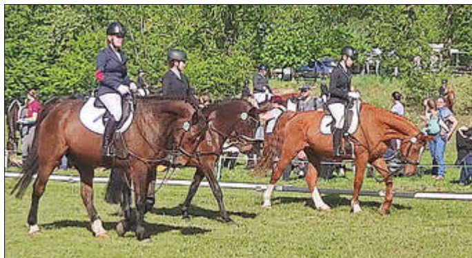
Impressionen vom Reitertag am Ersten Mai 2024