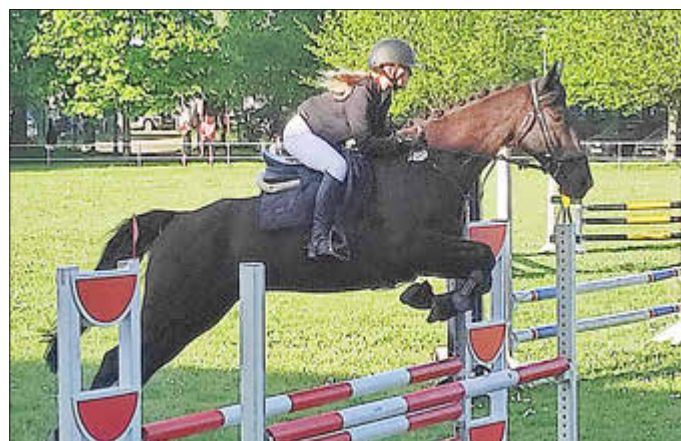
Vorgeschmack auf das Reit- und Springturnier