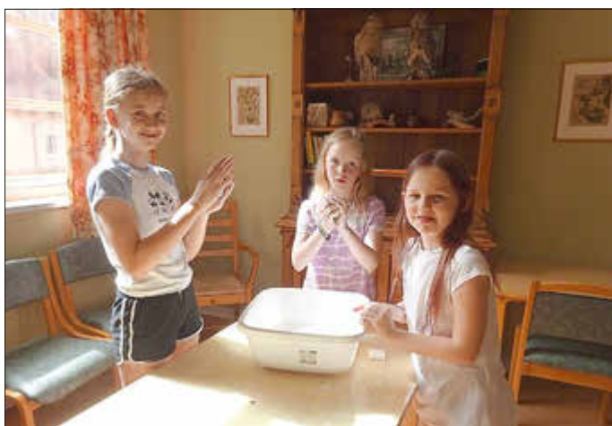
Beim Filzen mussten wir unsere Geduld unter Beweis stellen.