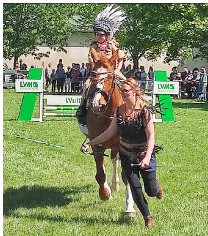
Schöne Kostümierung beim Führzügelwettbewerb